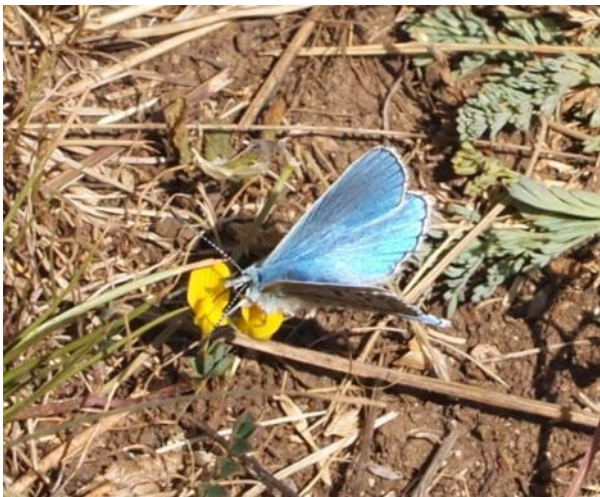
Le papillon bleu

La nature se reproduit, ne dérangeons pas ces Cétoines Dorées